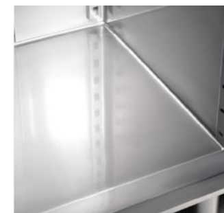
Fondo interno stampato Internal moulded bottom Fond intérieur moulé Gestanzter Innenboden