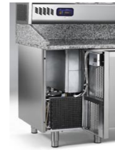
Pannello frontale banco refrigerato apribile Refrigerated bench hinged front panel Panneau frontal du comptoir réfrigéré sur charnières Aufklappbares Frontpaneel der gekühlten Theke

Tensione alimentazione - Voltage - Tension d'alimentation - Speisungsspannung 230/1/50