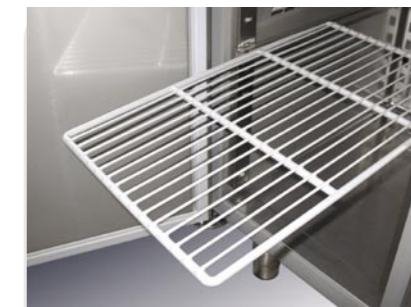
Guide antiribaltamento Anti-turnover slide-ways Glissières anti-renversement Anti-Umsturz Schienen