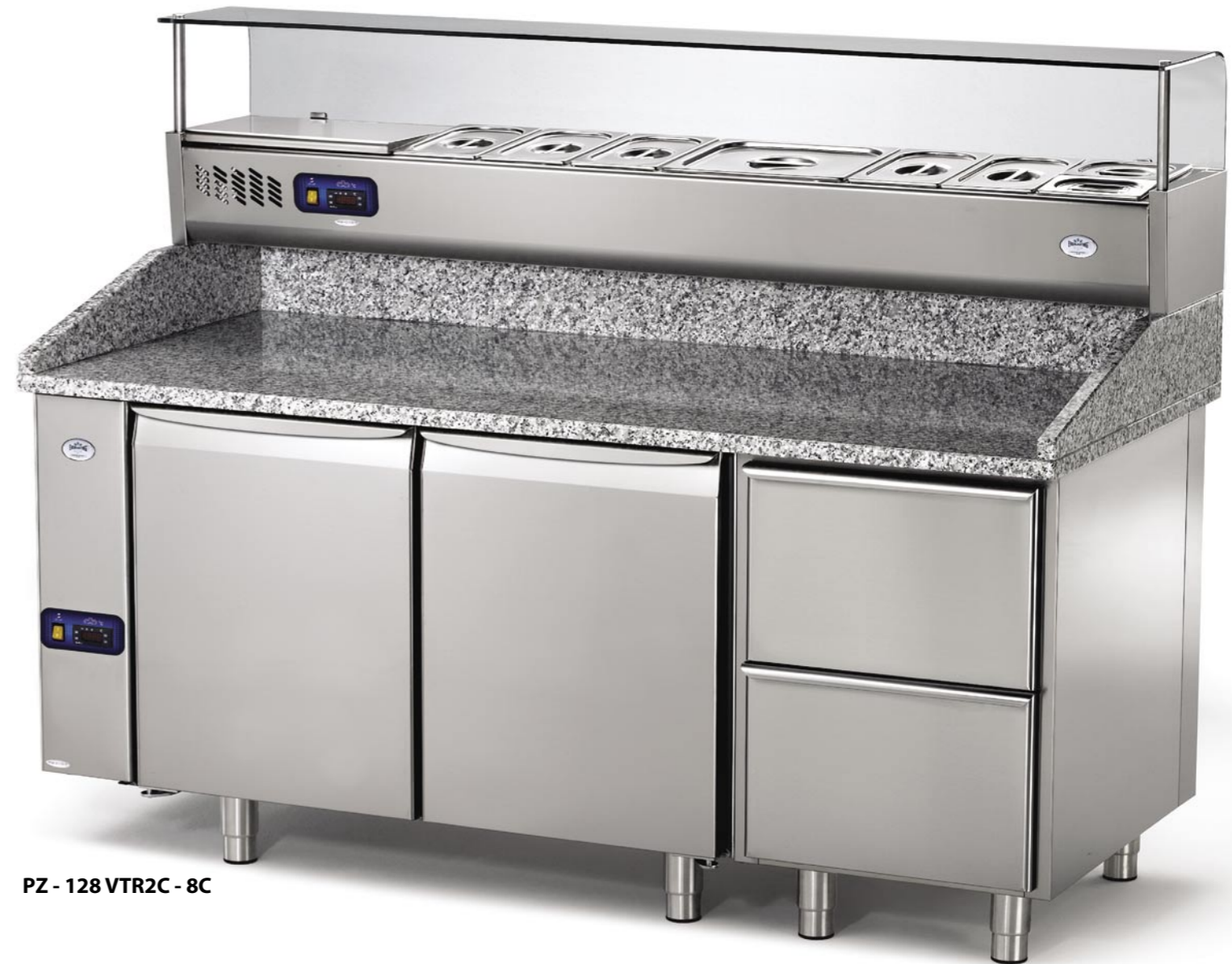
PZ - 128 VTR2C - 8C