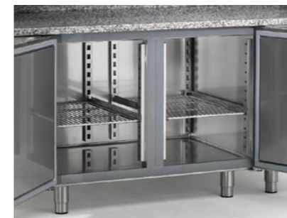
Massima capacità di stoccaggio Maximum storage capacity Capacité de conservation supérieure Maximale Lagerungskapazität