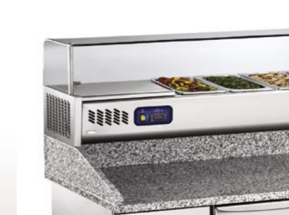
Abbinamento con vetrina Combination with refrigerated show case Combinaison avec vitrine réfrigérée Zusammensetzung mit Kühltheke