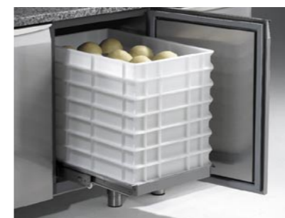
Telaio estraibile per contenitori Extractible frame for containers Châssis extractible pour bacs Ausziehbares Rahmen für Behälter