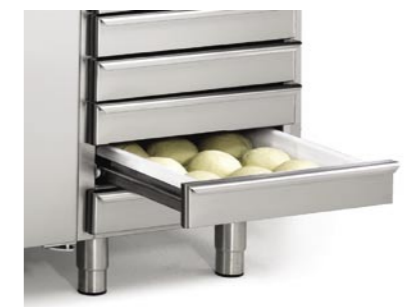
Cassetti per contenitori Drawer for containers Tiroir pour bacs Schublade für Behälter