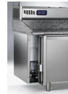
Pannello frontale apribile tavoli predisposti Pre-arranged working tables hinged front panel Panneau frontal des tables prédisposées sur charnières Aufklappbares Frontpaneel der voreingestellte- Arbeitstische