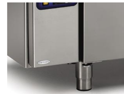
Piedini Inox regolabili Adjustable in height stainless steel feet Pieds en inox réglables en hauteur In Höhe verstellbare Stahlfüße