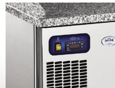
Pannello di controllo Control panel Panneau de contrôle Schalttafel