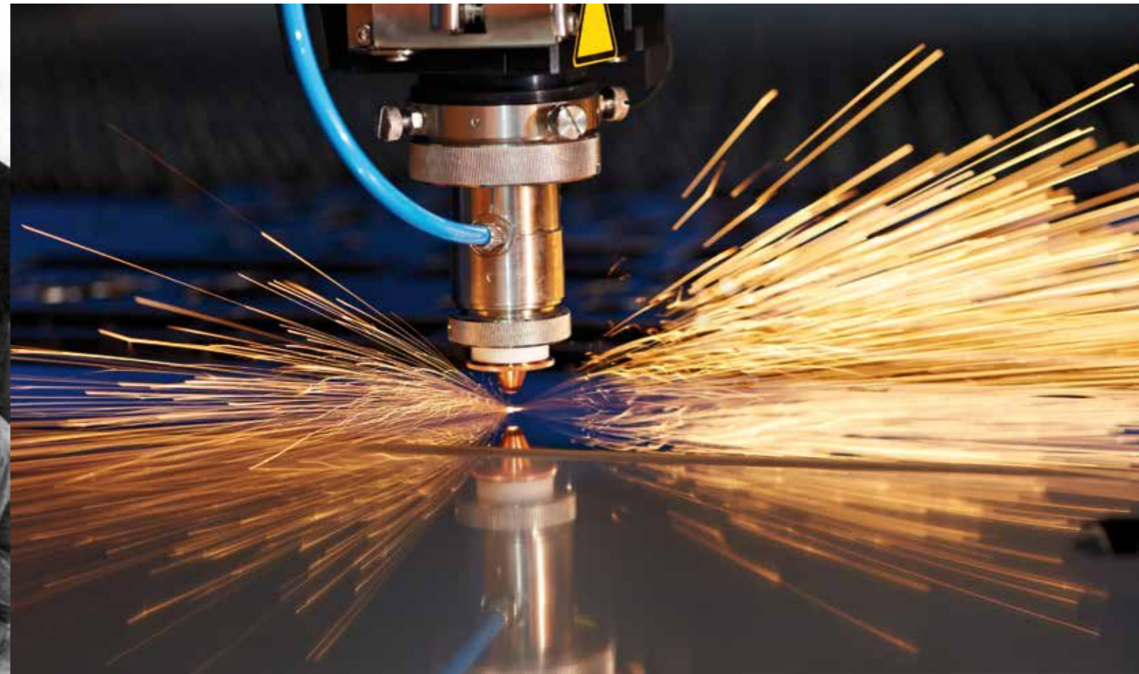
...Oggi - Today

ESPERIENZA, TECNOLOGIA AVANZATA, PRECISIONE, EFFICIENZA, DESIGN ELEGANTE e RISPETTO PER L'AMBIENTE.