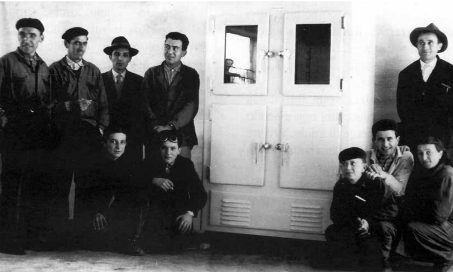
Anno 1956 - Year 1956...

Everlasting è oggi una delle aziende leader in Italia nella produzione di elementi refrigerati per impianti di ristorazione collettiva. In particolare è specializzata nella produzione di frigoriferi, armadi frigoriferi, tavoli frigoriferi, vetrine pizza, fabbricatori di ghiaccio, celle frigorifere, abbattitori di temperatura e altre attrezzature per la refrigerazione professionale.